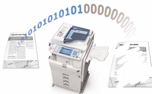
Nadpisywanie danych na dysku

Funkcje autoryzacji i szyfrowania służą do ochrony danych poufnych. Urządzenia MP C2050/MP C2550 są kompatybilne z opcjonalnymi pakietami bezpieczeństwa, takimi jak nadpisywanie danych na dysku twardym, zabezpieczenie kopiowania danych, autoryzacja kart i bezpieczne zwalnianie drukowania.